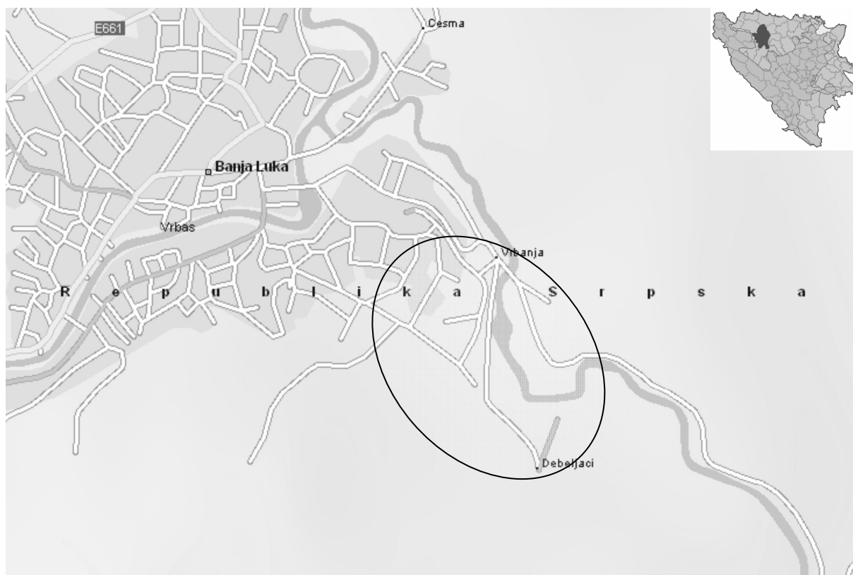
Slika 1. Geografski položaj područja istraživanja

Predmetni prostor nalazi se u istočnom dijelu grada Banja Luke, oko 3 km od njegovog središta. To je teren pretežno nižih brdskih uzvišenja koja omeđuje na jugoistoku prostranu aluvijalnu ravan doline Vrbasa u zoni ušća i donjeg toka Vrbanje. Dreniranje površinskih i podzemnih voda vrši se površinom padinama i potočnim jarugama u pravcu Vrbanje.